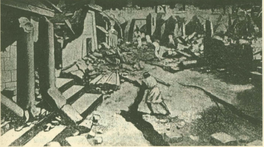
İstanbul'da bir deprem sonrası

Böylece, başkent olarak kuruluşundan XI.yüzyılın sonuna kadar İstanbul'un, içinde bulunduğu bölgede korkunç zararlara neden olan çok sayıdaki depremden diğer yerleşim merkezlerine göre daha az etkilenmiş olduğu belli olmaktadır.Sonuçta belirtmek istediğim husus, Bizans tarihçilerinin deprem konusundaki kayıtlarından çok şey öğrendiğimizdir. Bununla beraber onların verdikleri bilgilerden tahribatın ne ölçüde büyük olduğunu, halkın sayıca ne kadar can kaybına uğradığını ve depremlerin sosyal hayatı nasıl etkilediğini tam olarak öğrenmek mümkün olmuyor. Ancak, günümüzün bilim ve tekniğinden